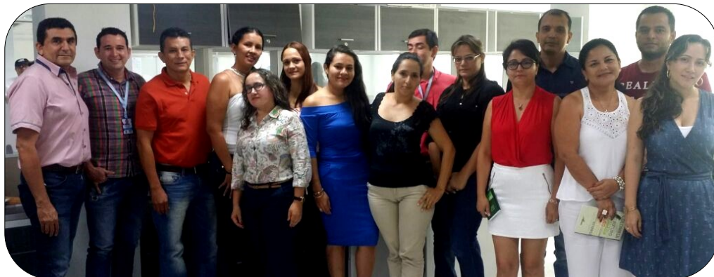
Equipo de Trabajo de la Secretaría de Gobierno; Profesionales del Proyecto de Asistencia Comunal 2016 de la Dirección de Convivencia y Desarrollo Comunitario

La Secretaría de Gobierno y Desarrollo Comunitario, es la dependencia encargada de resguardar las memorias históricas de los Organismos de Acción Comunal del Departamento; así mismo ejerce la vigilancia, inspección y control sobre la actuación de las Juntas de Acción Comunal y Juntas de Vivienda Comunitaria de acuerdo con las disposiciones legales y las competencias que el Ministerio de Interior delega a la Administración Departamental y teniendo en cuenta lo estipulado por la legislación colombiana y especialmente por lo dispuesto en la Ley 743 de 2002 y el Decreto Departamental N° 117 de 2011 en su artículo 26, numeral 4, donde es designada directamente esta competencia.